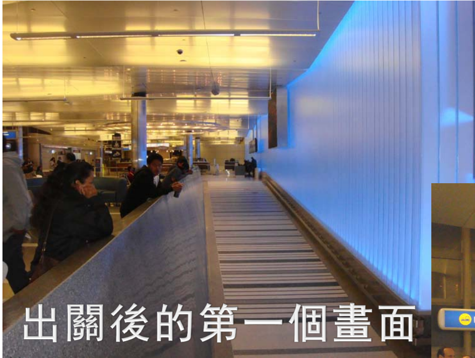
出關後的第一個畫面